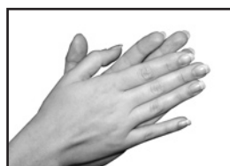
Тереть внутренние поверхности пальцев движениями вверх и вниз