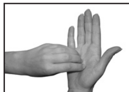
Поочередно, круговыми движениями тереть ладони

Рис. 1. Рекомендуемая техника мытья рук. Каждое движение повторяется не менее пяти раз