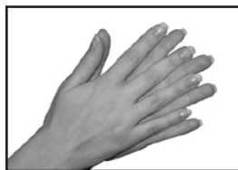
Тереть ладонью о ладонь

которое обычно не меняется в течение дня, а то и нескольких дней. При отсутствии бумажных полотенец могут быть использованы куски чистой ткани размером примерно 30 x 30 см для индивидуального пользования. После каждого использования такие полотенца следует сбрасывать в специально предназначенные для полотенец контейнеры для отправки в прачечную. Электрические сушилки в больнице бесполезны, т.к. процесс сушки длится очень долго и способствует развитию сухости кожи, и излишне шумен.