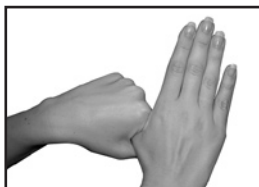
Тереть пальцы круговыми движениями