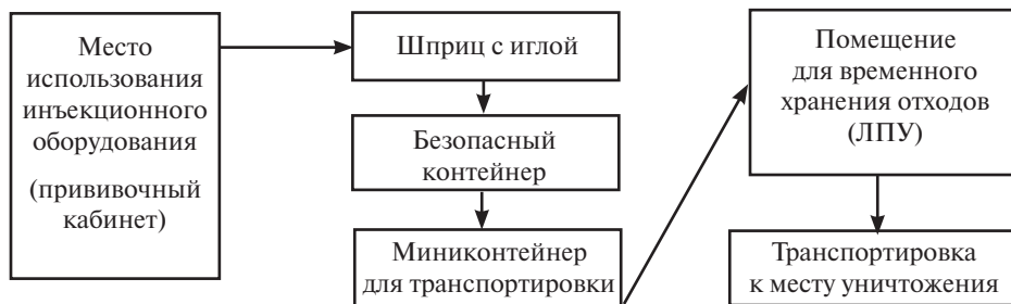
Схема 1. Метод сбора шприцев сразу после их использования в герметичные «безопасные» контейнеры

В день прививок в детское учреждение для сбора медицинских отходов из ЛПУ выдавали по два пластиковых контейнера необходимого объема (один для СР-шприцев, другой для прочих отходов — перчаток, тампонов, ампул от вакцин).