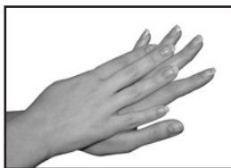
Правая ладонь по тыльной стороне левой руки и наоборот